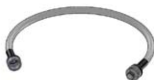
Tubo prolunga Dosicream