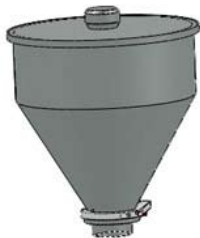
Tramoggia lt 8,5

Hopper group 8.5 lt for Dosicream-3 Cod. 12.T3