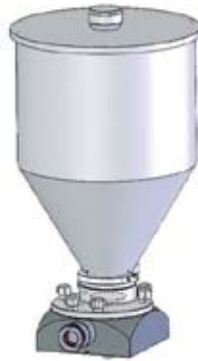
Gruppo tramoggia lt 13