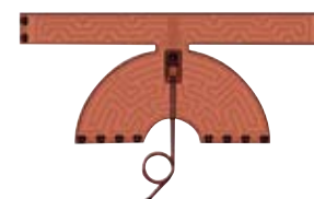
Fascia riscaldante per tramoggia da 8,5