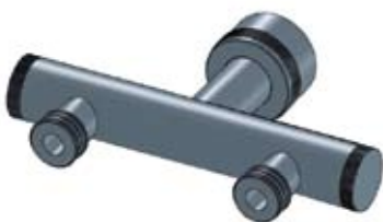
Adattatore tramoggia due uscite

Hopper 8.5 lt for Dosicream-3 Cod. 12.T6