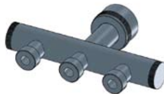
Adattatore tramoggia tre uscite

Hopper adaptor with two exits Cod. 12.A1