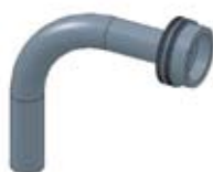
Beccuccio a curva per adattatore cm 8, Ø 14 mm