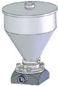
Gruppo tramoggia lt 8,5