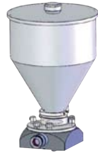
Gruppo tramoggia lt 8,5 per Dosicream-3

Hopper group 8.5 lt for Dosicream-3 Cod. 12.T3