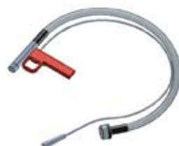
Tubo prolunga Dosicream con pistola