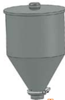
Tramoggia lt 13