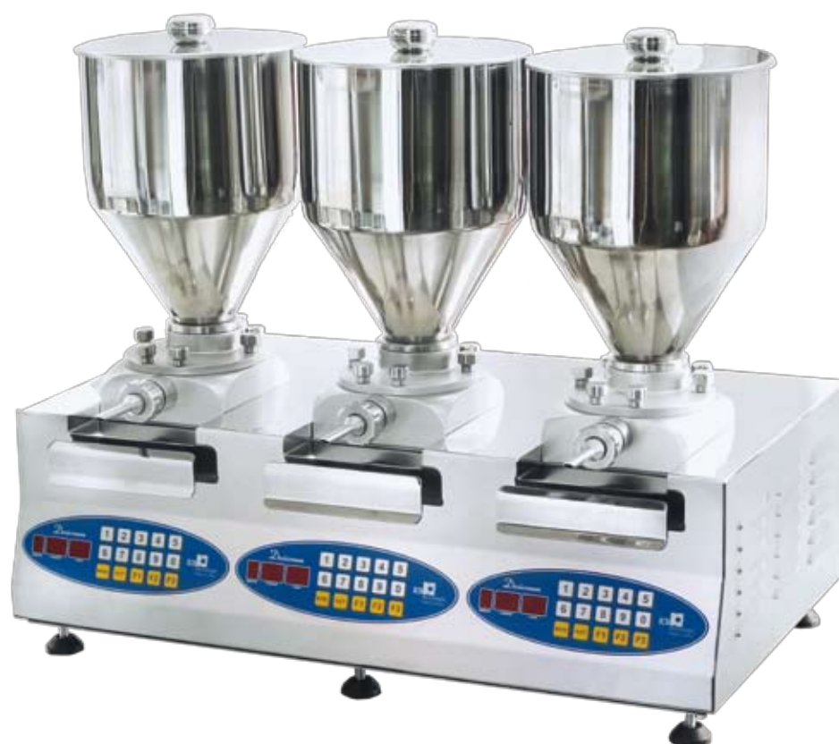
Dosiscream-3 Cod. 12.DOSI3