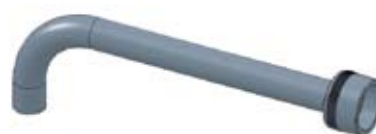
Beccuccio a curva cm 25, Ø 21 mm