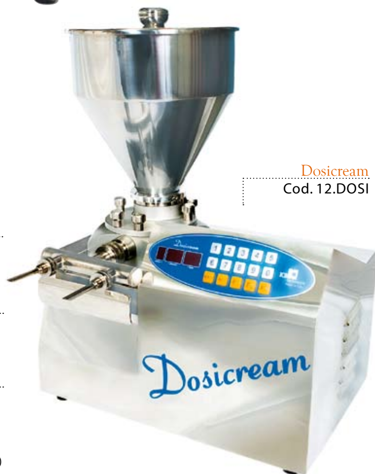
Dosiscream Cod. 12.DOSI