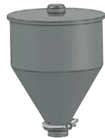
Tramoggia lt 8,5 per Dosicream-3

Hopper 8.5 lt for Dosicream-3 Cod. 12.T6